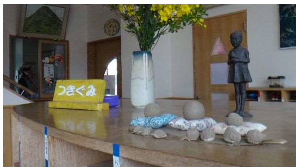
玄関に飾られたどろだんご。奥の窓は事務室、その上には千歳山の絵。